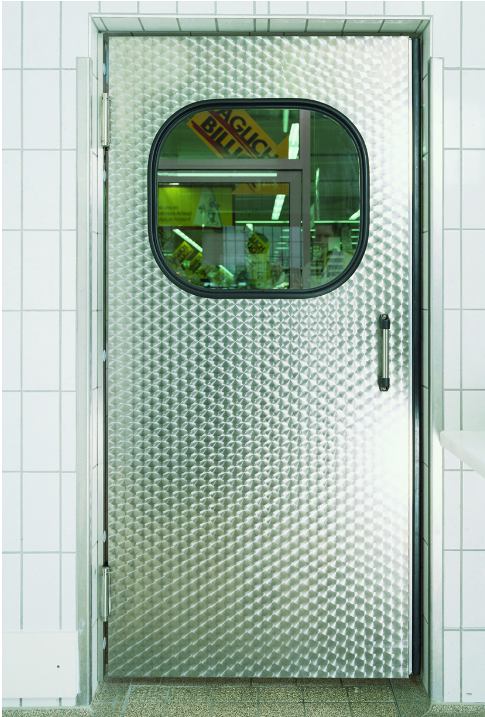
Bild: Pendeltür 1 flg. mit großen Fenster